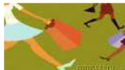
ゴールデンウィークは何をしようかな～？ 楽しみ、楽しみ！

リームズ・カム・トゥルーというバンドの「またね」という曲が大好きで何百回と聞きました。その曲は別れの曲で、好きな人が自分のやりたい事をかなえるために、住み慣れた町を離れる...そんな感じの歌です。そんな時にその人に想いを寄せている主人公が何か気持ちを伝えたいのに、「またね...」というのが精一杯。別れ際に握手をしたけど、その手にたくさん想いが詰まっていることも、相手には伝わらない...そんな内容の歌詞です。これはまさしく私のための歌だ！と最初に聞いた時から感じ、それ以来何度も何度も聞いています。今回、お声をかけていただいたときもそうです。もっとそこから色々なお話ができればいいのに、いつも通りの「あ、ありがとうございます...」で終わってしまいました。その度に「あの時、勇気を出して言っておけば良かったのに～」と後悔するく